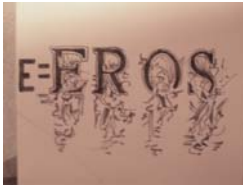
Sarenco 1 placca