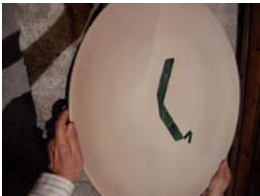
Ferrando 1 piatto