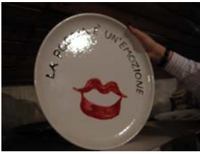
Malquori 1 piatto