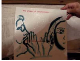
Miccini 2 placche